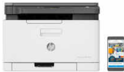
HP Color Laser MFP 178nwg

Arbeiten Sie effizient mit einem MFP, dem weltweit kleinsten seiner Klasse. 1 Drucken, scannen, kopieren und faxen 2 Sie mit hochwertigem Farbergebnis und drucken und scannen Sie von Ihrem Handy aus. 3