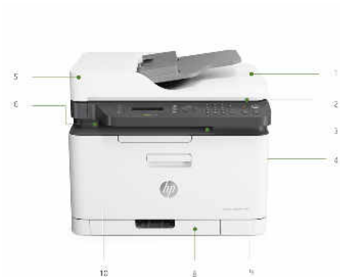
Abbildung: HP Laser 179fwg