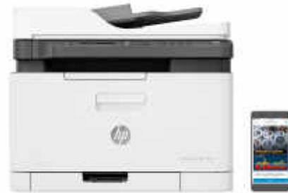
HP Color Laser MFP 179fwg

Dynamic-Security-fähiger Drucker. Ausschließlich für die Verwendung mit Patronen mit Original HP Chip vorgesehen. Patronen mit Chips anderer Hersteller funktionieren möglicherweise nicht oder in Zukunft nicht mehr. Weitere Informationen unter: